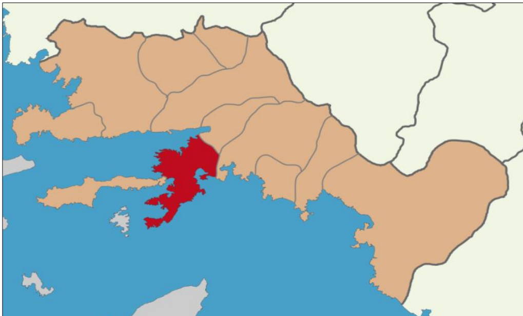
Harita 2 - Marmaris İlçesi'nin Konumu

Türkiye İstatistik Kurumu'nun (TÜİK) hazırlamış olduğu 2022 yılı Adrese Dayalı Nüfus Kayıt Sistemi (ADNKS) Nüfus Sayımı Sonuçlarına göre Muğla'nın Toplam Nüfusu 97.818 kişidir.