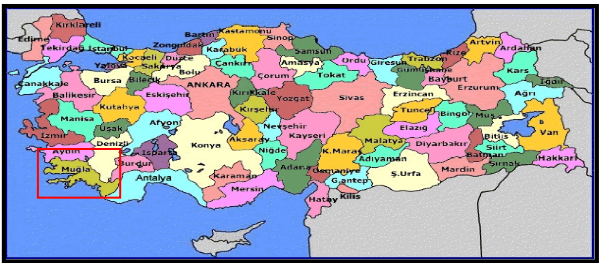
Harita 1 - Muğla'nın Konumu

Muğla denizden 670 m yükseklikte, üstü düz bir kaya kütlesi şekliyle ilginç bir görünüme sahip olan Asar Dağı'nın eteklerinde kurulmuştur. Muğla Ovası, Menteşe kalker platosunda Neojen çağında oluşmuş depresyonların sonradan karstlaşmasıyla oluşmuş çanak şeklindeki çukurluklardan biridir. Muğla ovasına benzer jeolojik yapıya sahip komşu ovalar Yeşilyurt, Ula, Gülağzı, Yerkesik, Akkaya, Çamköy, Yenice ovalarıdır. Muğla Ovası Karadağ, Kızıldağ, Asar dağı ve Hamursuz Dağı ile çevrelenmiştir. Düğerek'in kurulduğu yamaçların gerisinde rakım hızla artar ve Menteşe Dağları silsilesi içinde yer alan Yılanlı Dağı 2000 metreye ulaşır.